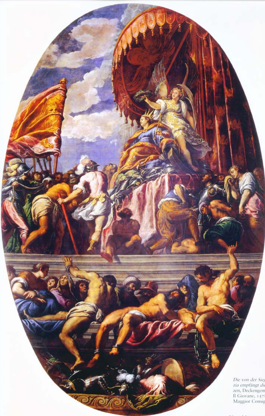
Die von der Siegesgöttin gekrönte Venezia empfängt die untergebenen Provinzen, Deckengemälde von Jacopo Palma il Giovane, 1578. Dogenpalast, Sala del Maggior Consiglio

Die Krönung der Venezia, 1578 Jacopo Palma, d.J.