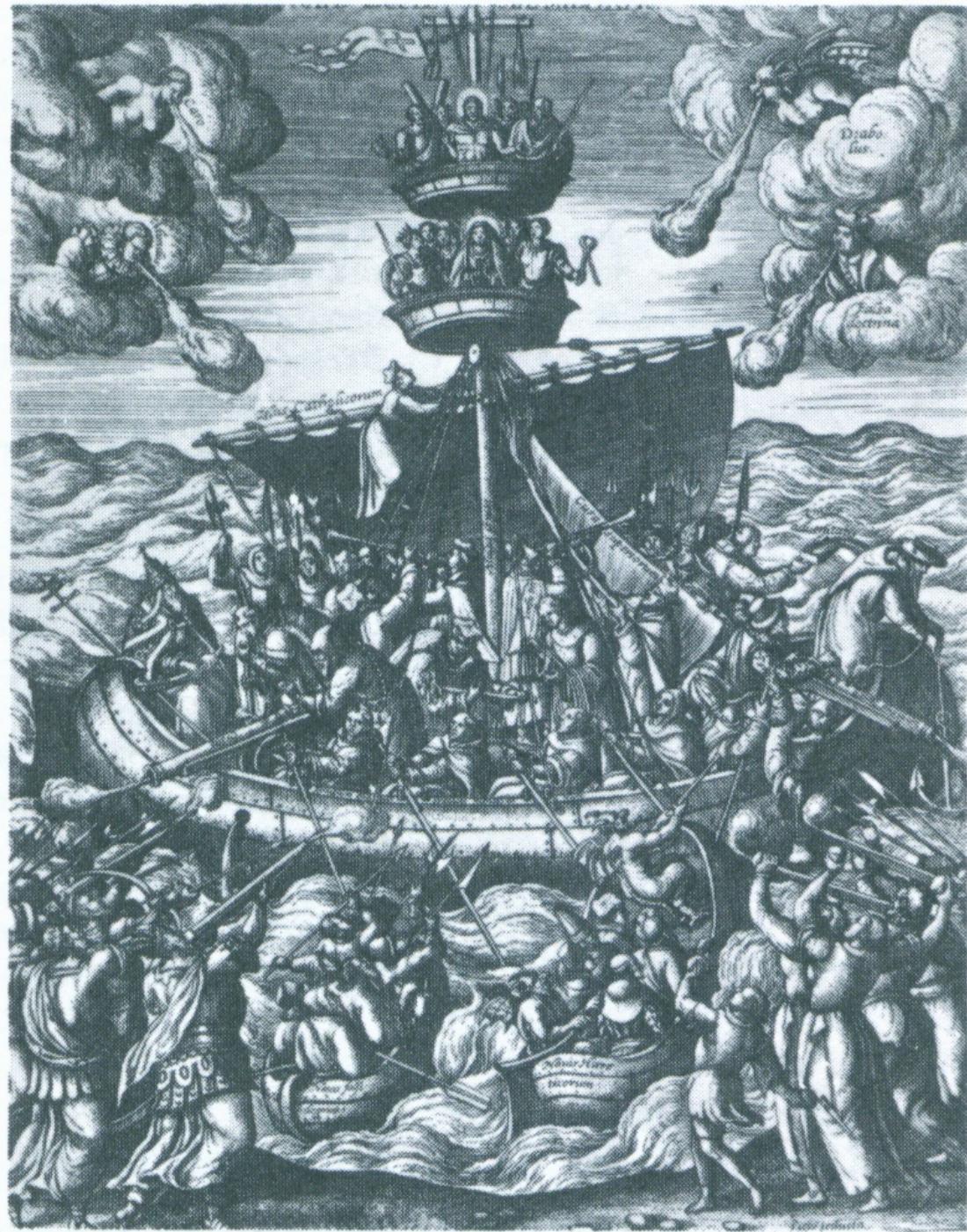
Navicula ecclesiae militantis. Antwerpen, Letztes Viertel des 16. Jh.s