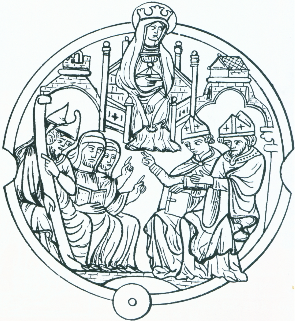
4.1 Disputatio unter Vorsitz der Ecclesia . Bible moralisée, um 1240