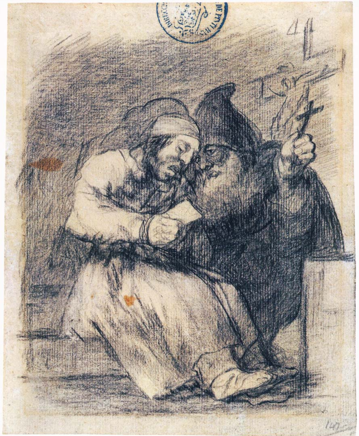
Francisco Goya „Er hilft ihm, gut zu sterben“ 1825