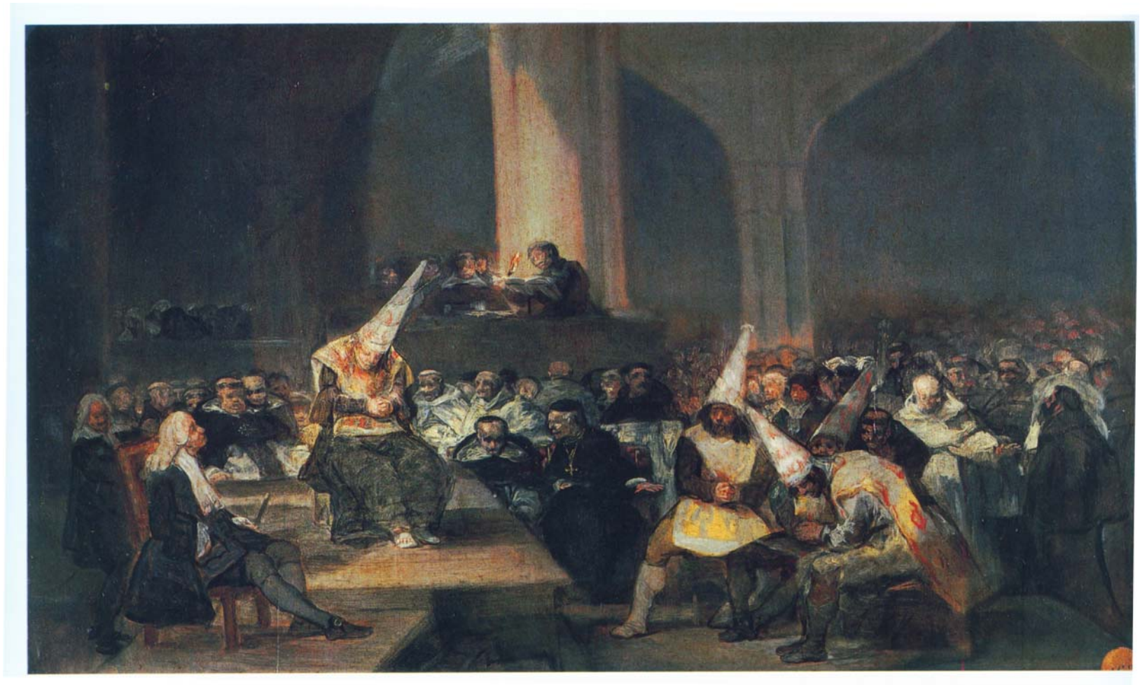
Francisco Goya 1812/1818 Inquisitionsgericht