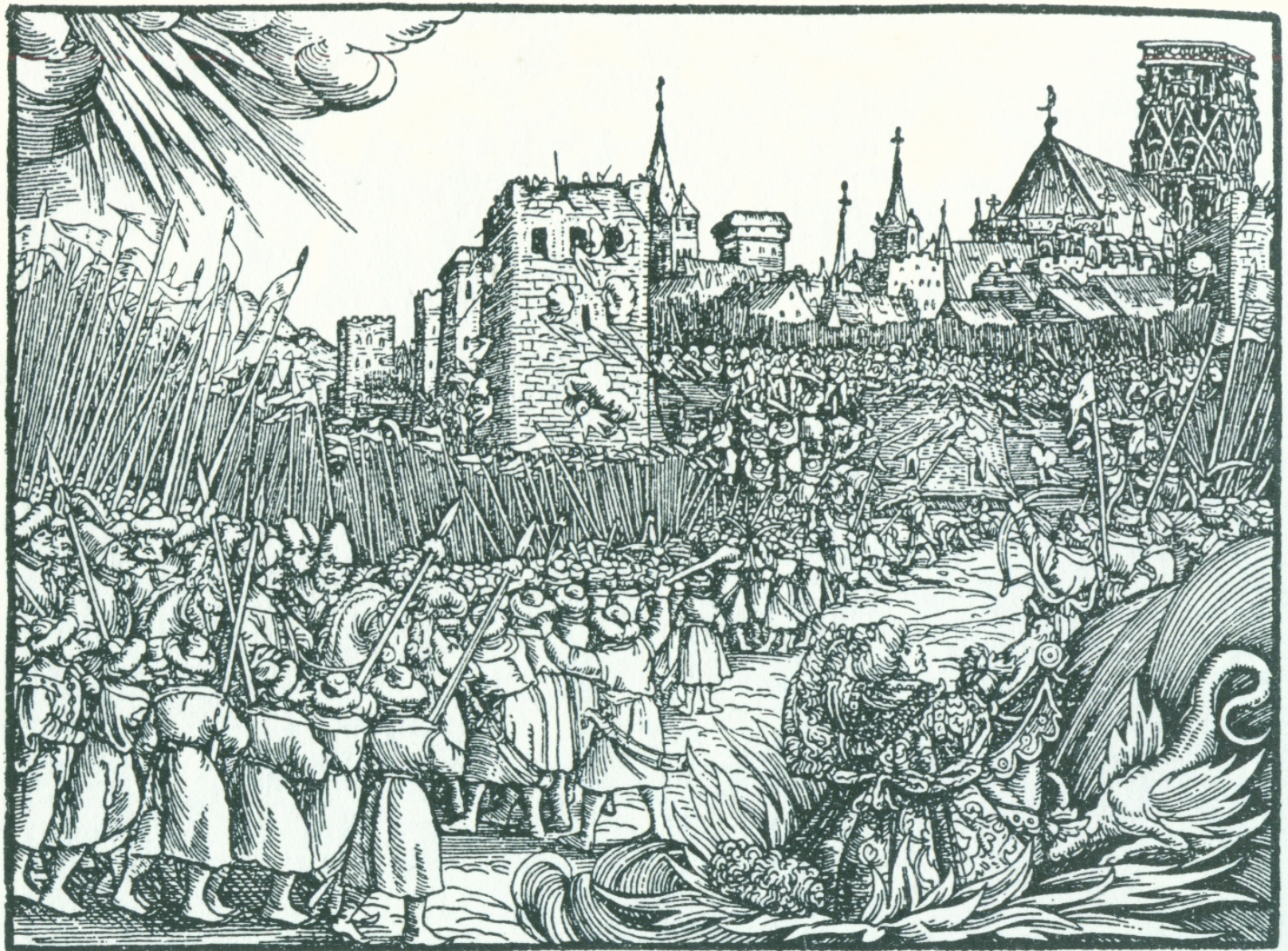
5.1 Gog und Magog (Apk. 20), aus der Luther-Bibel 1534